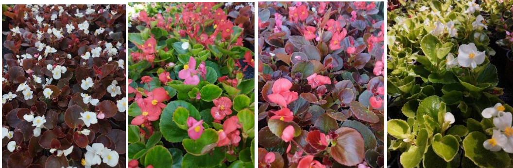
(Begonia angy mix, Begonia sally mix gp, Begonia funky white)